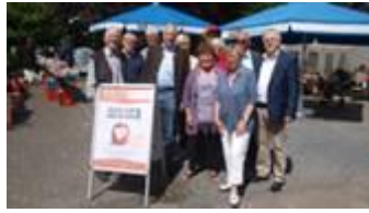
Fest der Tafel in Kürten