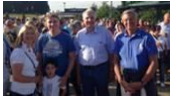
Benefiz Open Air für die Humanitäre Hilfe in Overath