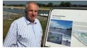
Hochwasserschutz - die größte Umweltgefahr für NRW beherzt angehen