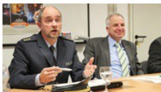
Neuer Abteilungsleiter der Polizei im CDU-Kreisvorstand