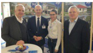
Erste Körtener Ausbildungsborse