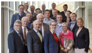
Katholische Landesarbeitsgemeinschaft zu Gesprächen im Landtag