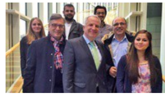
Union der Vielfalt zu Besuch im Landtag