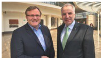
Bürgermeister Stefan Caplan mit Wochenpost Burscheid im Landtag